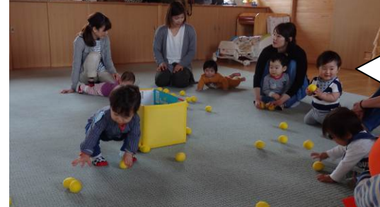
みんなで玉入れをしたよ☆みんなの前に玉を転がすと、興味津々。上手に玉を握れたね♪そのあとはママ達で玉入れ競争をしました。