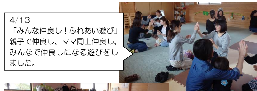
4/13 「みんな仲よし！ふれあい遊び」親子で仲よし、ママ同士仲よし、みんなで仲よしになる遊びをしました。